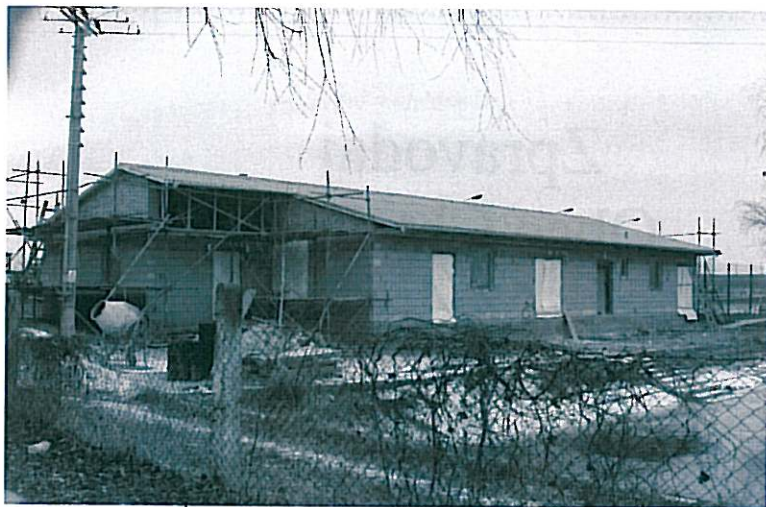
Výstavba nového zázemí pro SK Chvalovice